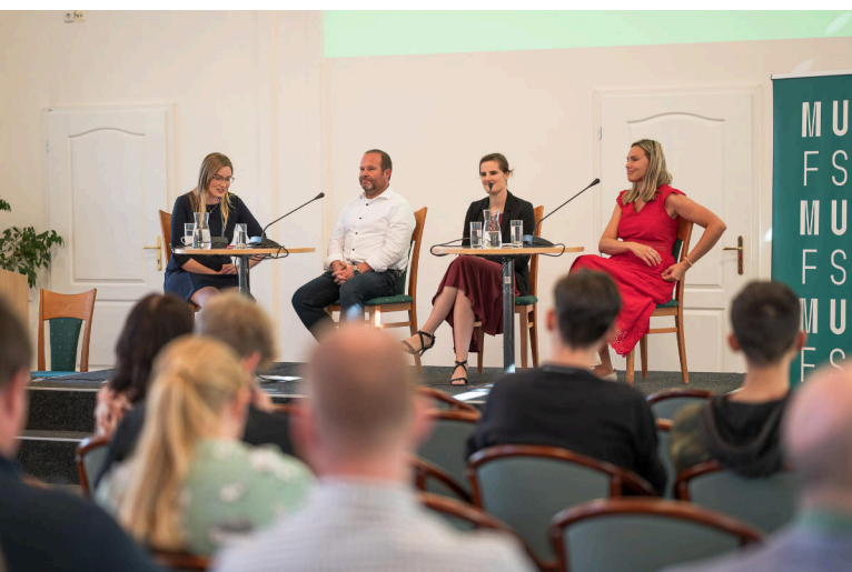
Konference Česká společnost očima FSS