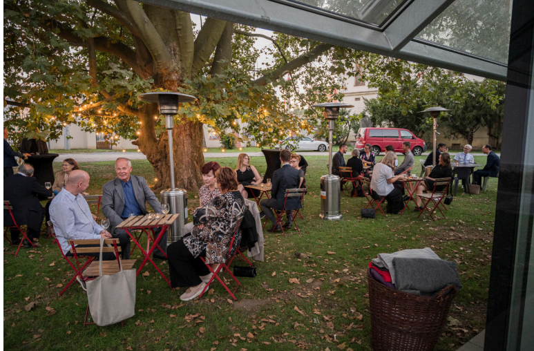
Zahradní slavnost a Stříbrné medaile MU