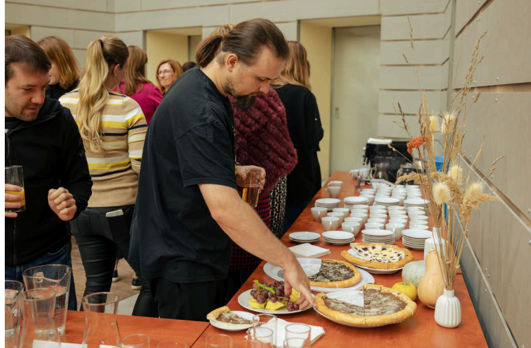
Čaj s děkanem