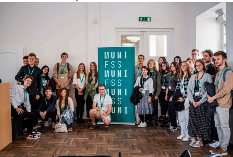
Konference Inocence Arnošta Bláhy