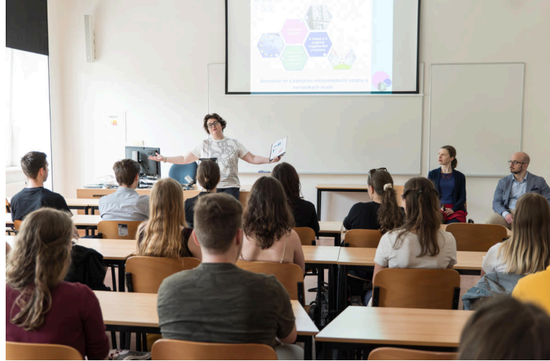
Buddies a První kroky s FSS