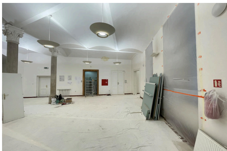
Rekonstrukce vodovodů a odpadů – 1. fáze