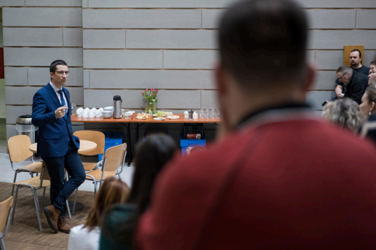
Čaj s děkanem