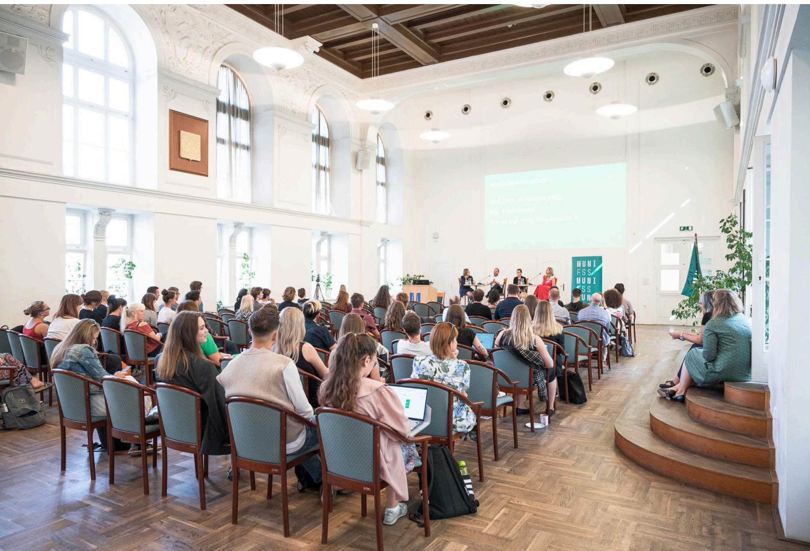
Konference Česká společnost očima FSS