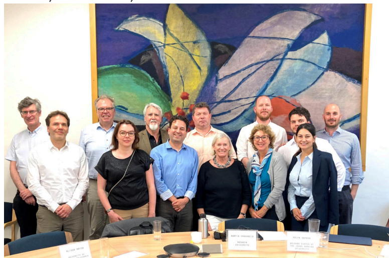
Mezinárodní workshop zaměřený na rusko-ukrajinskou válku a perspektivu střední Evropy