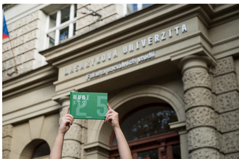
Výroční publikace, kterou FSS MU vydala k příležitosti 25. výročí svého založení