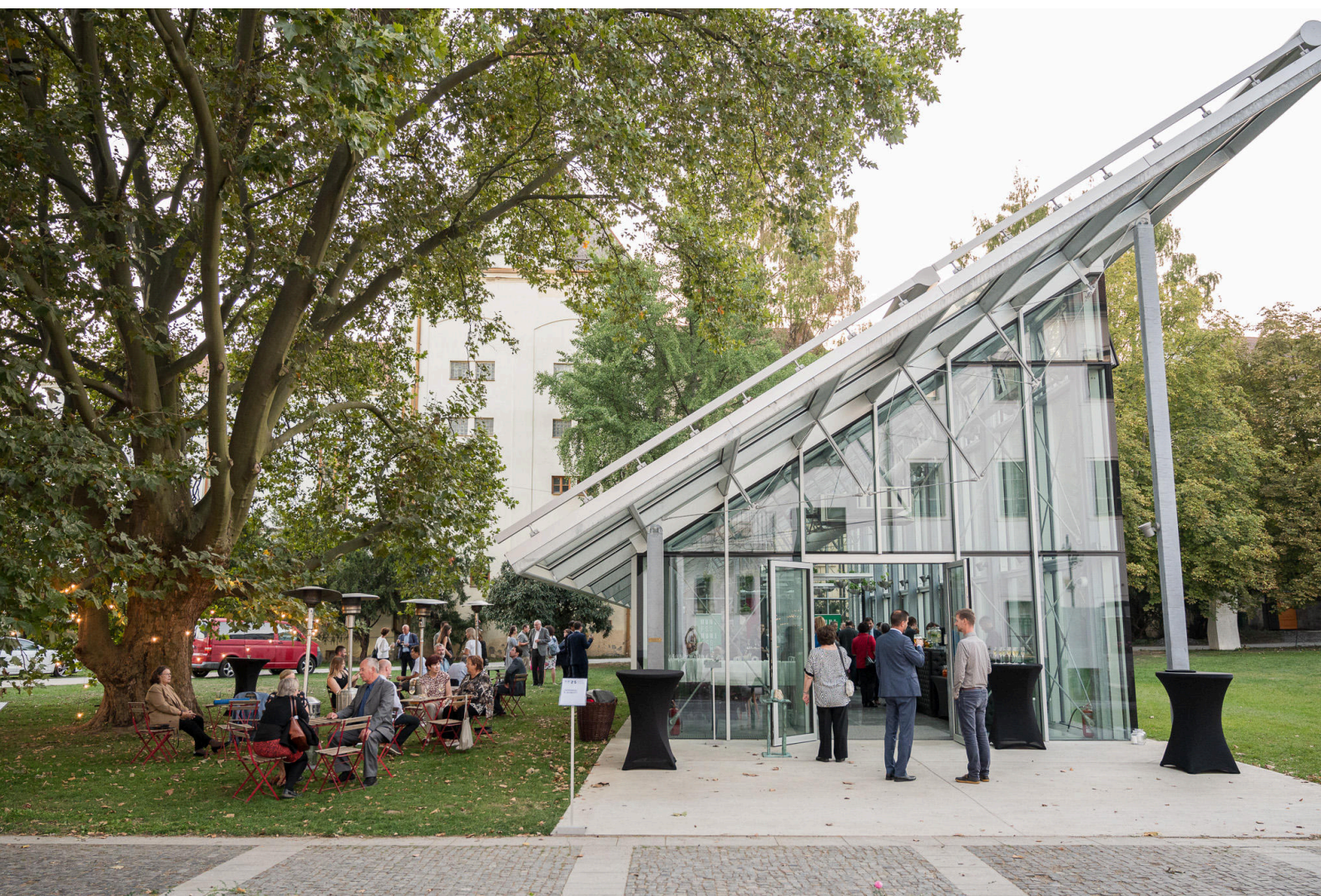
Zahradní slavnost a Stříbrné medaile MU (vše)