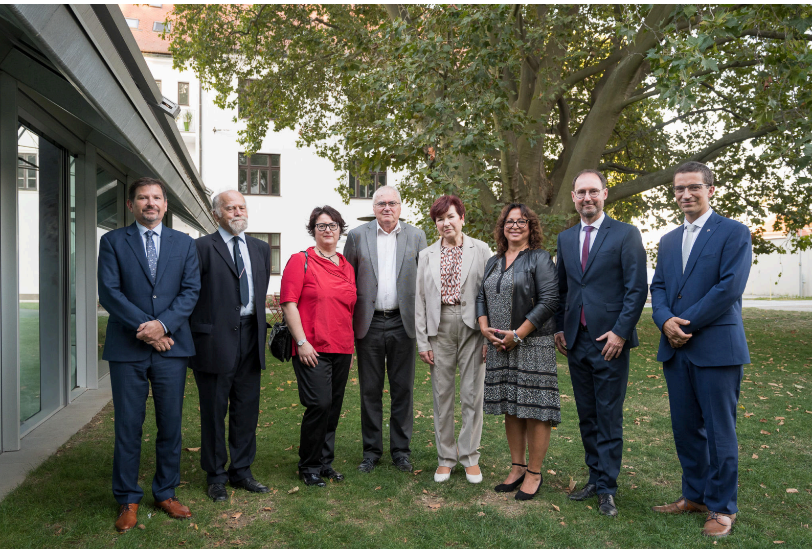
Zahradní slavnost a Stříbrné medaile MU (vše)