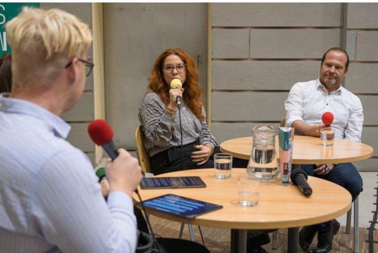
Veřejné natáčení podcastu Skryté příběhy soudobých dějin