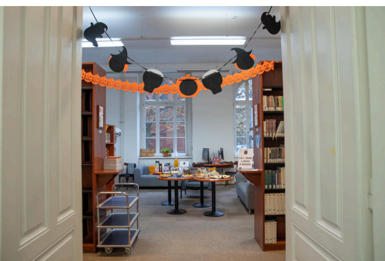
Halloweenský brunch s knihovnou