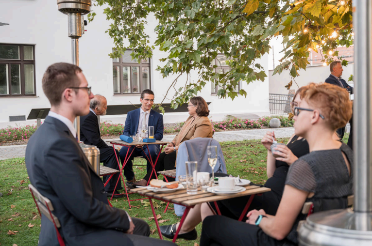
Zahradní slavnost a Stříbrné medaile MU