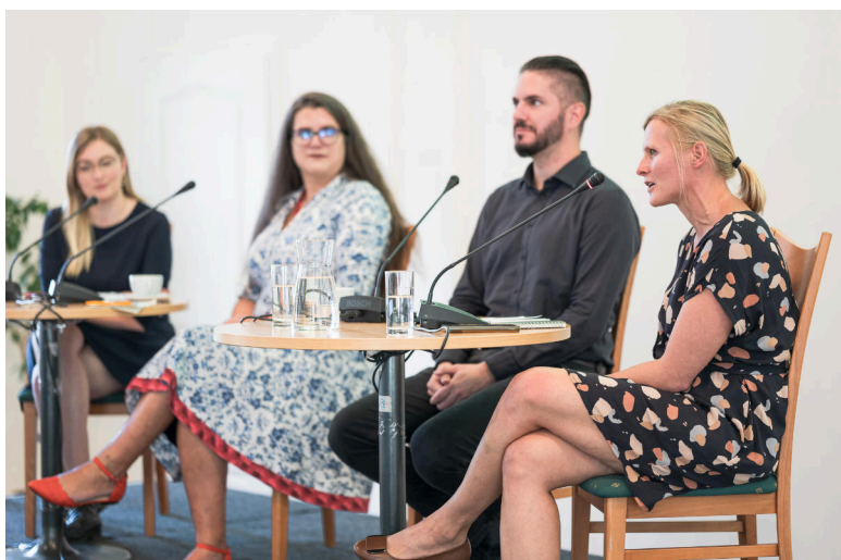
Konference Česká společnost očima FSS