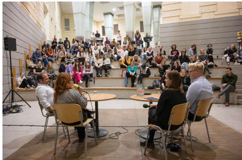
Veřejné natáčení podcastu Skryté příběhy soudobých dějin